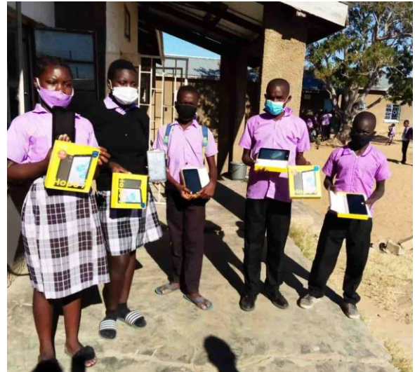
Leerlingen van SODC met de nieuwe ZEDuPads